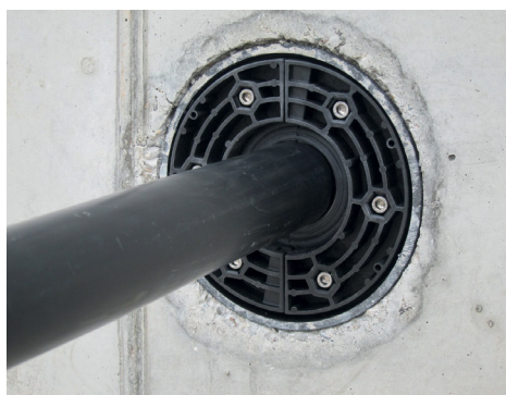
HRK 150 SSG 1x36-70