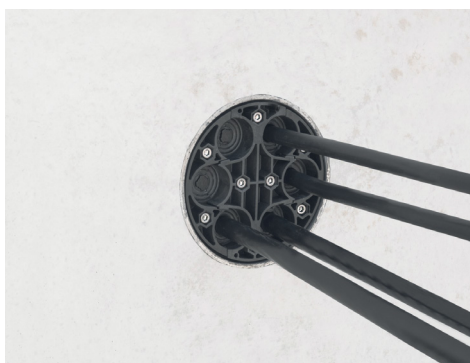
HRK 150 SSG 6x10-36