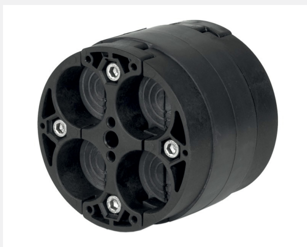
HRK 100 SSG 4x8-30

Univerzální těsnění HRK SSG je vynikající řešení pro utěsnění kabelů v jádrových vrtech nebo pažnicích (chráničkách) o vnitřním průměru 100, 150 nebo 200 mm s těsností do 2,5 baru. Jeho velkou výhodou je nízká cena, jednoduchá montáž a vysoká variabilita. Technologie segmentových prstenců umožňuje přizpůsobení se průměrům procházejících kabelů. Označení jednotlivých prstenců dělá tento proces ještě snazší a rychlejší. Je dělené a kdykoli připravené k montáži na nově pokládané nebo již stávající kabely. Díky slepým zátkám lze osadit menší množství kabelů a ostatní otvory nechat zaslepené jako rezervu pro možnost pozdější instalace. Přítlačné desky jsou vyrobeny z robustního polyamidu zpevněného skelnými vlákny, těsnící kotouč z odolné gumy EPDM a šrouby a matice z nerezové oceli.