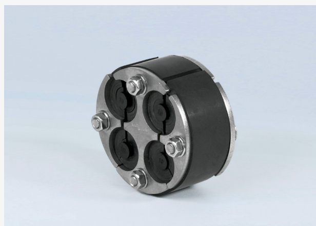
HRD 100 SG 4x8-30