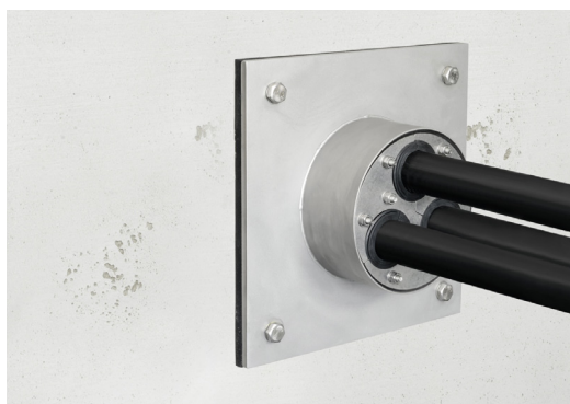
HRD 150 SG 3x22-54 v přírubě HRD F