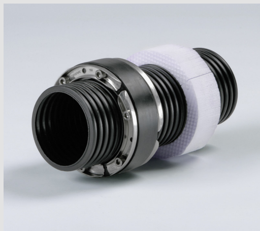
Instalace korugovaného potrubí